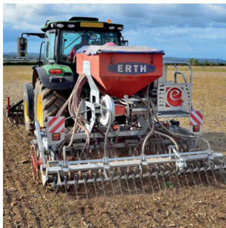
Pro X - 24-rzędowy 3-metrowy zbiornik o pojemności 1000 l